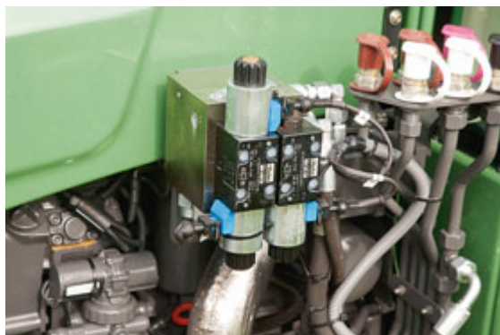
Für die Fernbedienung der Lenkung wird ein zusätzlicher Lenkventilblock eingebaut.