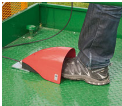
Der fernbediente Schlepper fährt nur, wenn der Fußschalter durchgetreten ist.