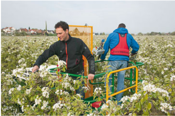
Von der Hubarbeitsbühne aus lässt es sich bequem arbeiten. Vorne dran, man sieht es kaum, ist ein Fendt 200 Vario ohne Fahrer!

zylinder zur Feststellbremse 1A-Qualität haben. Er ist deshalb aus Edelstahl und wassergeschützt. Jeder Zug, den die Firma Kremler verbaut, wurde einzeln geprüft und mit einer Prüfnummer versehen.