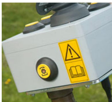
Auch die Zapfwelle kann per Fernbedienung ein- und ausgeschaltet werden. Das ist nützlich z. B. für den Betrieb einer pneumatischen Baumschere.