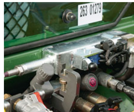
Die Lebensversicherung: Ein zusätzlicher Zylinder schließt die Federspeicherbremse in Notfällen.