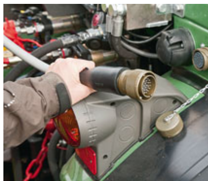
Die Fernbedienung ist per Kabel über eine so genannte Cannon-Steckdose im Schlepperheck verbunden. Diese sowie einen kompletten zweiten Kabelbaum rüstet Armin Kremler für den Vario Assistant nach.

Außerdem findet man auf dem Pult Drucktaster zum Ein- und Ausschalten der Zapfwelle sowie Taster für die Verstellung der Seitenneigung des Schlepperhubwerks (eine Option der Profi-Ausrüstung von Fendt). Ein Kabel verbindet das Bedienpult mit dem Schlepper.