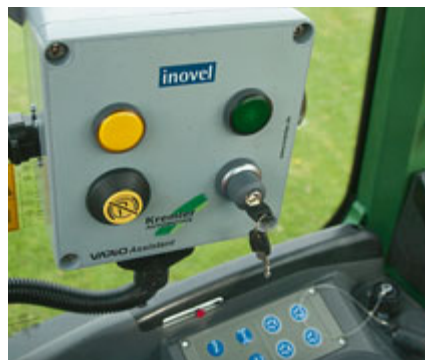
Am Steuerkasten in der Kabine stellt man vom internen auf den externen Fahrbetrieb um.

Wir haben die Fernbedienung selbst ausprobiert. Sie funktioniert. Das Fahren von der Arbeitsbühne aus kommt einem im ersten Moment zwar erst mal seltsam vor. Aber wer häufiger mit dem zur selbstfahrenden Arbeitsbühne umfunktionierten Fendt 200 Vario arbeitet, wird sich sicher schnell an das Fahren in bis zu 2,90 m Höhe gewöhnen. Allerdings ist zumindest für kleine Personen die Sicht nach vorne vor den Schlepper nicht ganz so gut wie von der Kabine aus. Eine Überwachungskamera könnte hier helfen. Sicherstellen sollte man auf jeden